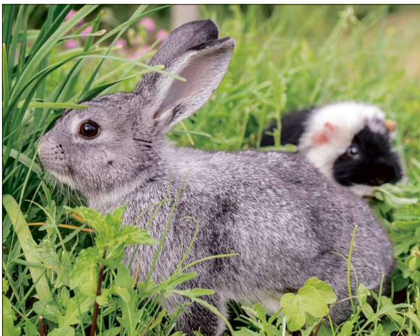
Betg be chauns e giats, mabain er ulteriurs animals da chasa sa laschan tschertgar sur la Centrala svizra per animals sparids e chattads.